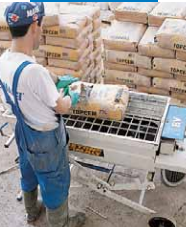
Mezcla de Topcem con mezclador con sinfín

Humedad residual después de 4 días (%): < 2,0