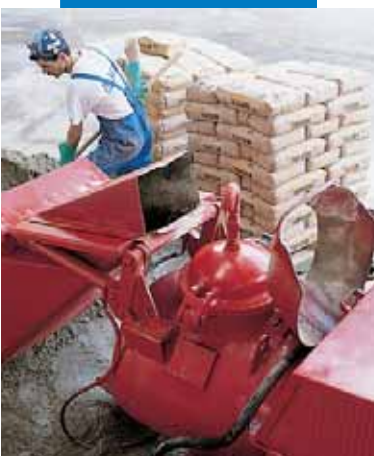
Mezcla de Topcem con sistema automático de bombeo