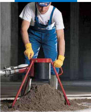
Suministro del mortero Topcem