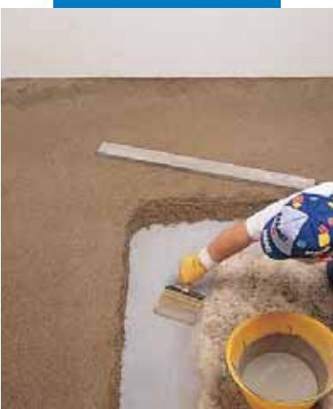
Aplicación de la lechada de adherencia para recrecidos de Topcem adheridos