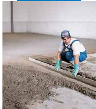
Formación de maestras

Temperatura de servicio: de -30°C a +90°C