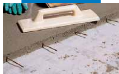
Detalle del recrecido con Topcem con las esperas de la junta de trabajo