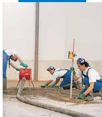
Aplicación de la mezcla de Topcem