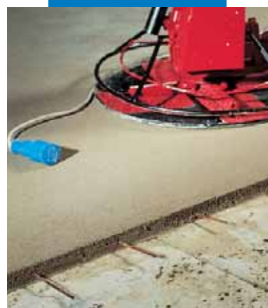
Acabado superficial con helicóptero