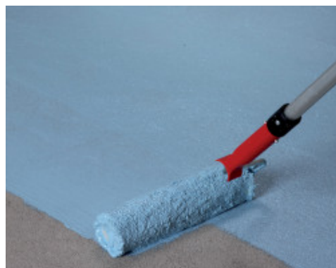
Aplicación de la primera capa de Mapelastic® AquaDefense sobre un recrido