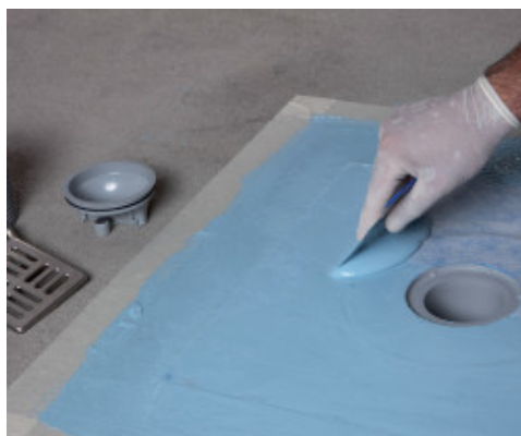
Sujeción del tejido de Drain Vertical con Mapelastic® AquaDefense