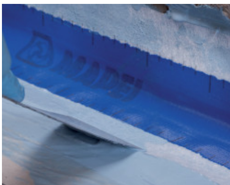
Aplicación de Mapeband en la unión pared-pavimento con Mapelastic® AquaDefense