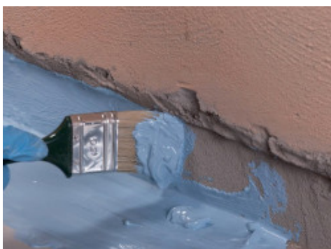
Aplicación con brocha de Mapelastic® AquaDefense en la unión pared-pavimento, antes de la aplicación de Mapeband