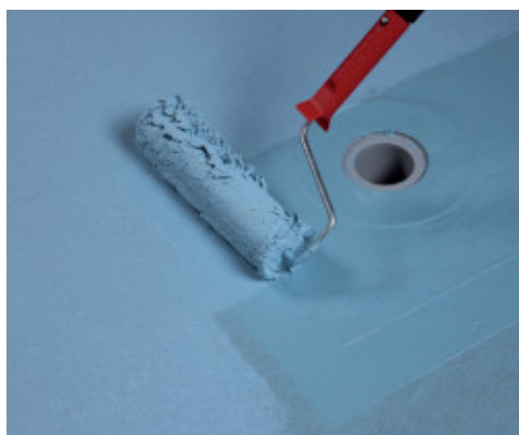
Aplicación con rodillo de la segunda capa de Mapelastic® AquaDefense